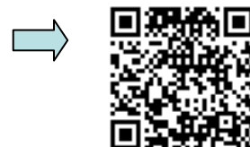
アイ・ヘルパースク ールの フェイスブック ページ